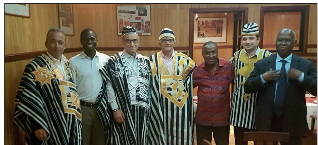
Accueil convivial de la délégation de la SMN ayant animé un séminaire de formation à Abidjan en 2018

Quelques années à peine après sa création, l'AFRAN avait englobé tous les pays africains, pour devenir l'organisation panafricaine officielle fédératrice des sociétés nationales de néphrologie. Ceci l'a qualifiée pour servir aujourd'hui de lien fédérateur entre les néphrologues africains et de liaison principale entre la néphrologie africaine et celle du reste du monde.