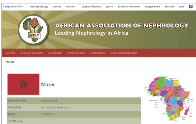
Page du Maroc sur le site Web de l'AFRAN ( https://afan.org/ )